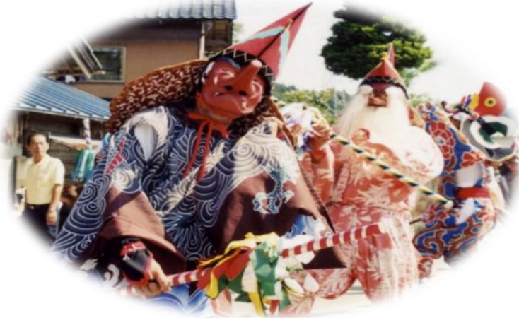
地元 お熊甲祭り奉賛会も歓迎の舞で出演します

月日:9月10日(日) 時間:12:35~ 場所:能登演劇堂 対象:昭和24年4月1日以前にお生まれの方 今年は例年開催の敬老会を取りやめて 「北陸文化ノ百花繚乱」を楽しんで頂きます。