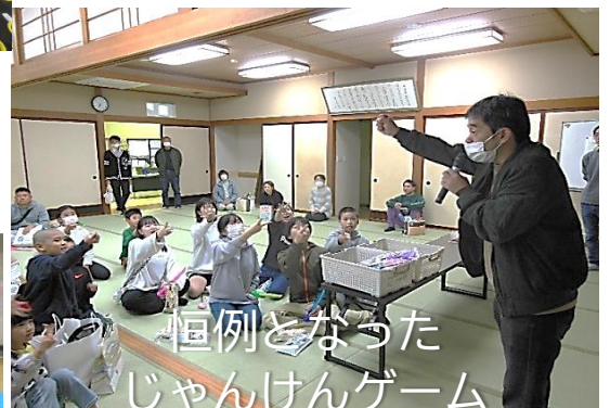
恒例となった じゃんけんゲーム