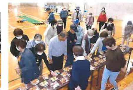
どれにしようかなあ～楽しいパン選び