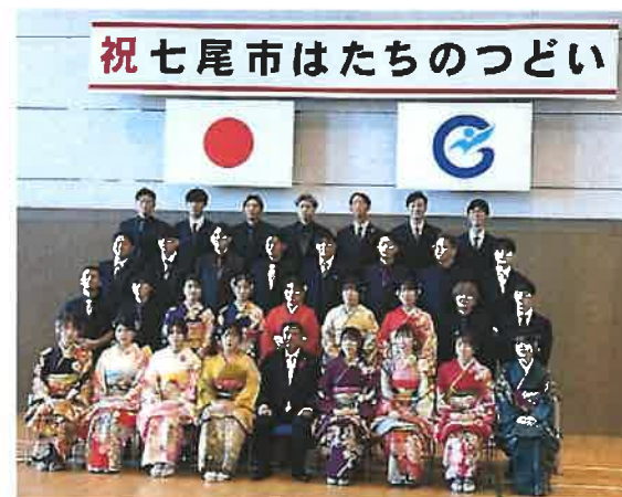
みんなで記念写真撮影