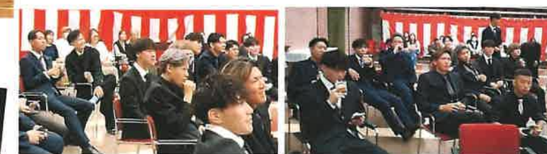
中島小・中学校の思い出のスライドショーを見ながら歓談