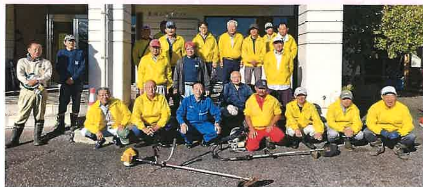
来年の桜が楽しみです！早朝よりお疲れさまでした。