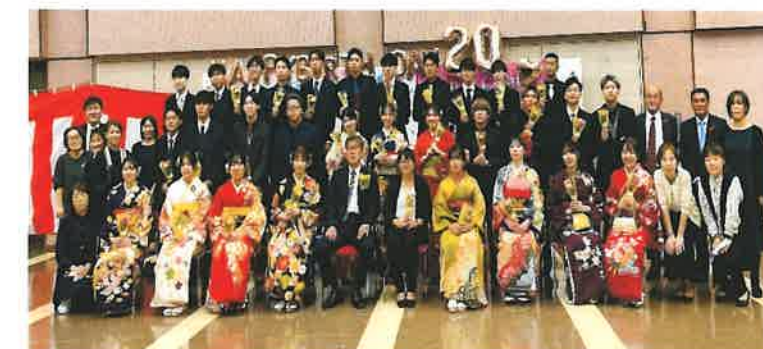
中学校恩師と一緒に！笑顔いっぱい！うれしい再会