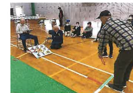
狙いを定めて！それ！