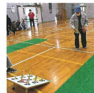
めざせ！パーフェクト！