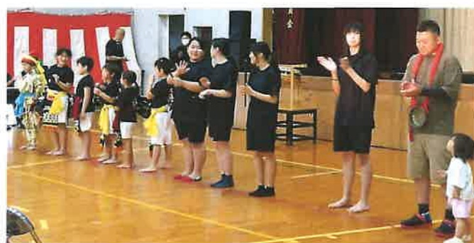
ますまのご長寿を願って パンザイ〜