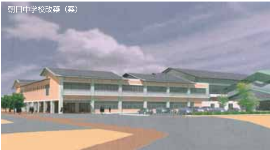
朝日中学校改築（案）

今後の対応ですが、まず市民から提言についての意見をいただくかなければならないと思っております。その意見を聞いた段階で、どういう形が望ましいか、そういった市民合意を得て、次の整備計画を進めていかなければならないと市長から答弁がありました。