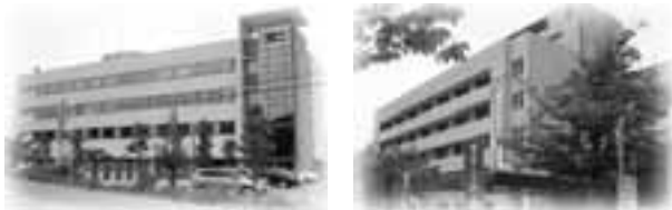
住所地の税務署・自治体