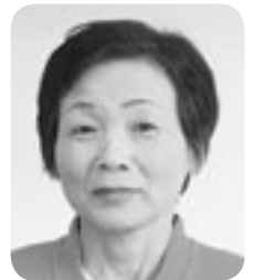
伊藤 厚子 議員