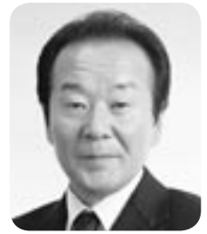
松本 精一 議員