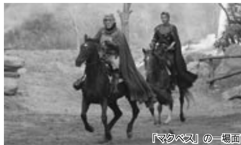
「マクベス」の一場面

が七尾市にとっての経済効果と言えるかと思えます。また、今回のロングラン公演は能登演劇堂でしかできない演出、そして舞台であったという高い評価をいただき、今後も能登限定公演をしてほしいとの多くの声もたくさんいただいています。