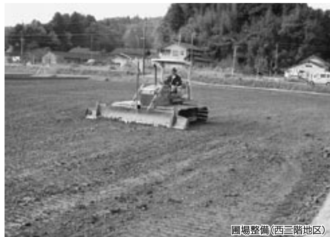
圃場整備(西三階地区)

現在、国の圃場整備の工事については、標準工事で大体10アール当たり200万円程度と見込まれています。この事業は、国が55%、県が30%、あとの15%はいわゆる受益者負担という形で七尾市と土地の権利者と