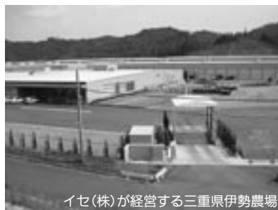
イセ(株)が経営する三重県伊勢農場

も、イセ株式会社に対し地元合意を得るための努力をしていただきたいとお願しているところで、そういう状況です。議員が心配されるようなことは、あってはならないし、そういったものを建設させないようにして進めていきたいと考えています。