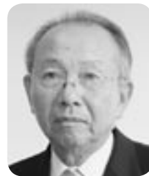
柱 徹男 議員