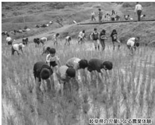
岐阜県の児童による農業体験