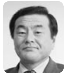
久保 吉彦 議員