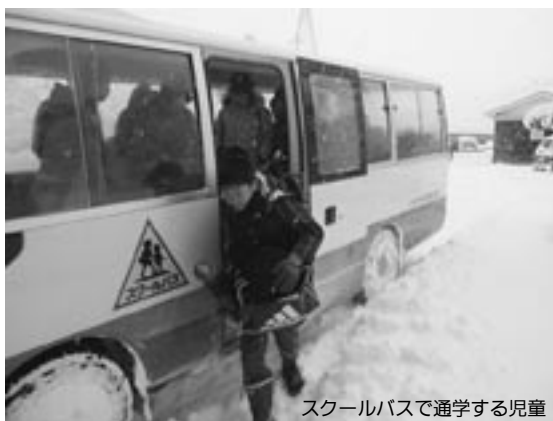
スクールバスで通学する児童

の運行を予定しています。土曜日、日曜日、祝祭日、そして長期休業日についても部活動に対応するための運行を考えています。なお、登下校時以外の活用については、校外活動、社会見学、他校への貸し出しなど、学校教育に係る活用を考えています。