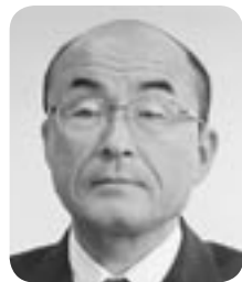
山添 和良 議員