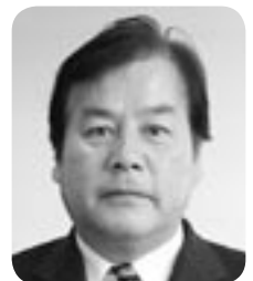
木下 敬夫 議員