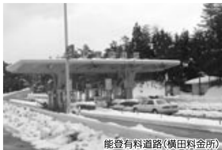
能登有料道路(横田料金所)

も能登有料道路のみならず、有料道路へのアクセス道路やバイパス等の道路整備も早くしていただかなければなりません。そういうものも含めて取り組んでいかなければならないと思っており、今、一丸となつて署名運動や要請活動をすることについては、まとまりにくいのではないかと考えています。