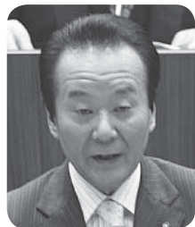
松本 精一 議員