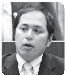
山崎 智之 議員