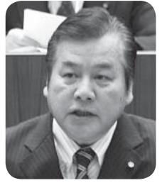
木下 敬夫 議員