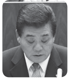
垣内 武司 議員