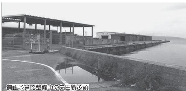
補正予算で整備中の矢田新ふ頭

完成予定件数は38件で、事業費としては4億9,780万1,000円です。繰り越しを予定している7事業については、3月までの概算払い額で5億2,619万6,000円です。3月までに支払う金額の合計は10億2,399万7,000円で全体事業費の76%です。