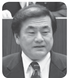
久保 吉彦 議員