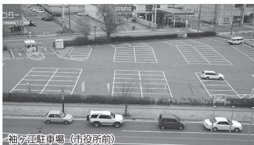
袖ヶ江駐車場(市役所前)

現在の袖ヶ江駐車場の駐車可能台数は96台で、日常の利用には十分であると考えています。しかし、議会開催時や会議等が重なっているときは、袖ヶ江駐車場が満車になることが予想されますが、市役所の裏の駐車可能台数65台の袖ヶ江第2立体駐車場の利用や、七尾サンライフプラザやフォーラム七尾、サンビーム日和ヶ丘等での会議の開催で対応できると考えています。そうした中、4月から無料化試行について適正な利用を促し、目的外の利用をしないよう啓発し、また、利用実態調査を行い適正な無料化へ時間帯等を検討していくことにしています。