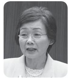
伊藤 厚子 議員