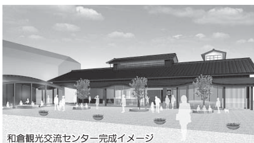
和倉観光交流センター完成イメージ

和倉のまちづくりの中で、総湯の建て替えに伴い、交流センターを七尾市がかわせて設置するわけですが、この交流センターの前に足湯を整備する予定です。必要性についての質問がありました。現在も総湯前に足湯があり、この足湯も多くの観光客の方々に喜んでいただいていますので、