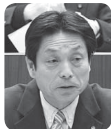
永崎 陽 議員