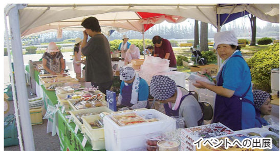
イベントへの出展

す。さらに、新しい取り組みとして、生産拡大をさらに進めるために栽培する作物や出荷時期、他の産地との差別化を図り、新たな販路拡大に取り組み認定農業者、生産団体に支援を行う予算も計上しています。 その他の質問項目 ■ ふるさと納税 ■ ケーブルテレビ ■ 教育関連