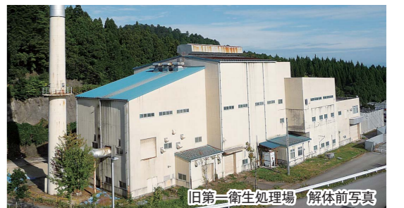
旧第一衛生処理場 解体前写真

遵守されているかなどを確認、把握していきます。さらに、監視委員会においても環境面、安全面に十分配慮した解体工事になっているか、直に確認していただくことになっていきます。 その他の質問項目 ■ 迷惑防止対応 ■ 七尾市の経済 ■ 力キ殻処理施設 ■ 水産業の振興 ■ 生活保護基準引き下げ