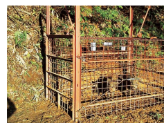
捕獲されたイノシシ