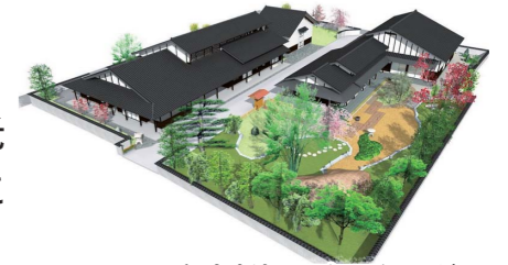
観光交流センターイメージ図