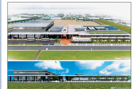
七尾中学校完成予想図

平成27年第1回臨時議会が1月27日の1日間の会期で行われた。市長から提案された議案1件、報告1件が各常任委員会に付託され、審議された。その後、各常任委員長から委員会における審査の経過と結果が報告され、採決を行った結果、議案1件および報告1件は全会一致をもって可決・承認され、第1回臨時議会を閉会した。