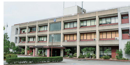
旧能登島市民センター