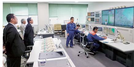
現在の消防司令システム