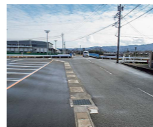
七尾中学校周辺の道路

その他の質問項目 ■里山里海の取り組み ■市内図書館の充実と存続 ■子育て支援強化策