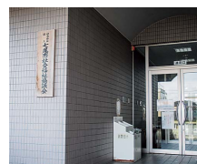
地域包括支援センター

その他の質問項目 ■残業時間 ■児童虐待死 ■不登校 ■全国学力テスト ■アベノミクス ■オプジーボ