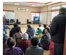
避難訓練時の避難所の様子