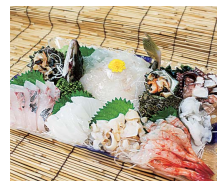
ふるさと納税の一部

その他の質問項目 ■市政2期目の姿勢 ■行政機能の効率化 ■能登立国1300年 ■幼保小連携