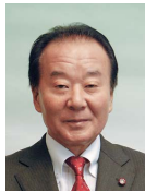
松本 精一 議員(65歳) 逝去