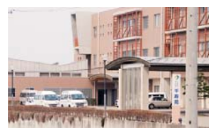
市内の福祉避難所