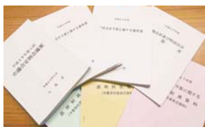
新年度当初予算にかかる予算書