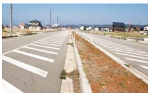
万行土地区画整理事業の道路