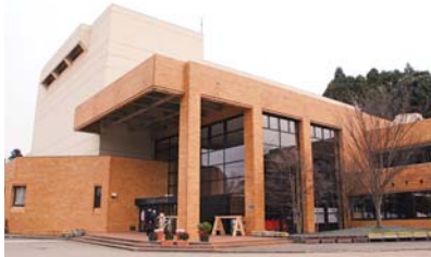
和倉温泉観光会館