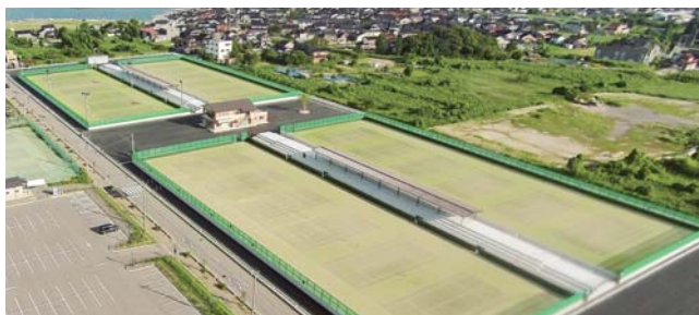
和倉温泉運動公園テニスコート