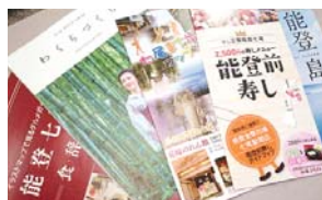
市内の観光パンフレット