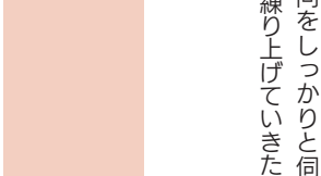
和倉温泉観光会館