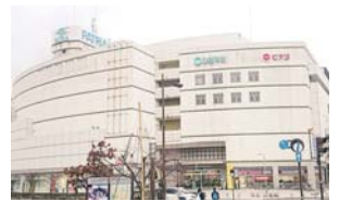
駅前商業施設パトリア