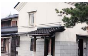
事務局が入る予定のしるべ蔵