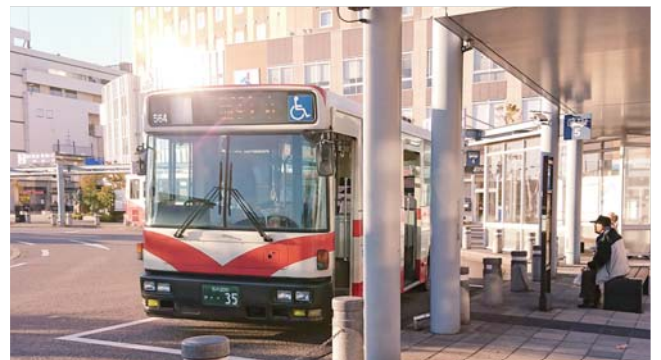
市内を走る路線バス