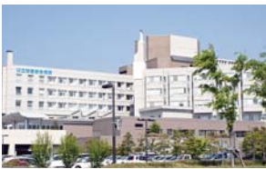
公立能登総合病院