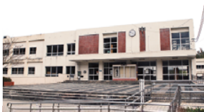
空き校舎となった御祓中学校