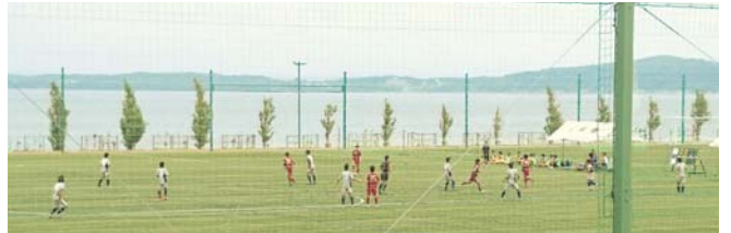
和倉温泉運動公園多目的グラウンド