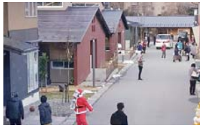
先進事例であるシェア金沢(金沢市)