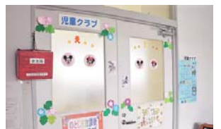
市内の放課後児童クラブ