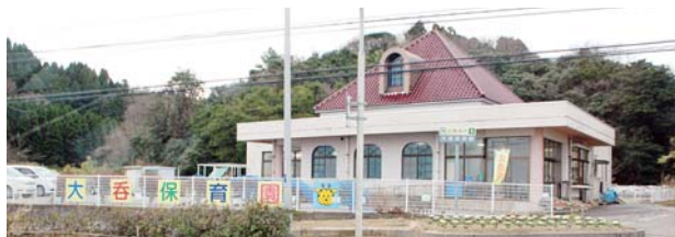
平成30年3月末で閉園の大呑保育園