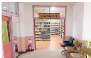
杉森文庫を保管してある旧有隣保育園