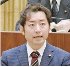
西川 英伸 議員 (新国会)

七尾市では、平成25年にハッピーリタイヤメント構想というものを打ち出しおり、提案された七尾版CCRCは、私どもが進めているこの範疇にしっかりと含まれており、実績も上がり、現在進行形であるものと理解していただきたい。日本版CCRCは、首都圏の高齢者問題への対応が根底にあり、高齢者を元気なうちに地方に送り出し、保育園がない、保育士がいらないといった待機児童問題のような轍を踏まぬようにとの思いで、国の政策誘導、狙いがそこにある。市の第2次総合計画において、七尾市でひと花もふた花も咲かせたい、頑張ってみようという元気な人材を世代にこだわらず、あらゆる方々を対象とした移住定住対策を盛り込んでいきたい。七尾市活性の戦力にしたいと思っている。