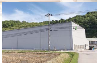
市内に新設された企業・(株)バイテックファーム七尾