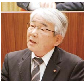
議員 和典 議員 (無党派)

子ども医療費の助成対象年齢を18歳までに拡大することに検討していきたい。また、月額の自己負担1,000円をなくし全額助成することについても財源探しも含めて検討していきたい。窓口無料化については、実施しているほとんどの自治体において過剰受診なども一因だということも言われており、医療費の増大による新たな財源も必要になってくる。医療機関を受診される際に自己負担を一旦納めてもらい、そのことで子どもの健康について改めて気を配っていただきたいと思っており、窓口での無料化については、時期尚早と考えている。月額1,000円の助成と年齢の拡大を合わせて、約3,000万円程度の財源が必要になるという試算もしている。この財源は、一つには事務事業の見直しも含めて、しっかりとその財源探しをしていきたい。