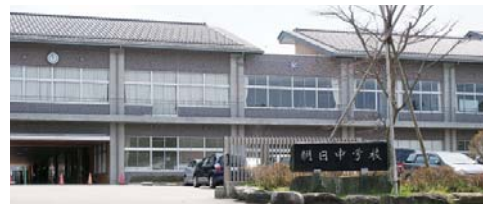
平成30年4月開校の朝日小学校(旧朝日中学校)