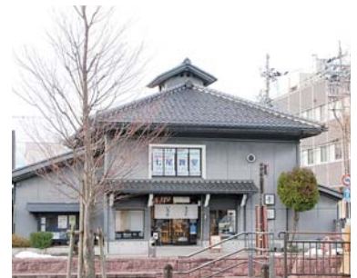
御戒川大通り沿いにある寄合処御祓館