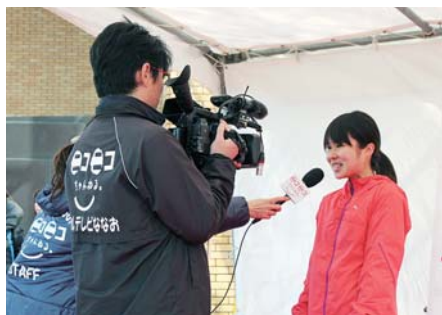
ケーブルテレビの撮影の様子