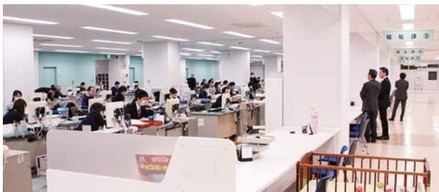
パトリア3階で1月から業務を行う市役所健康福祉部