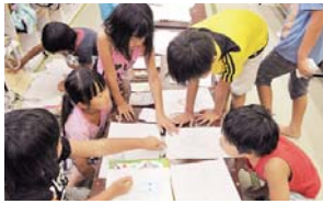
市内の放課後児童クラブ