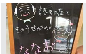
市内の認知症カフェ