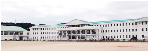
平成30年4月から統合する東湊小学校