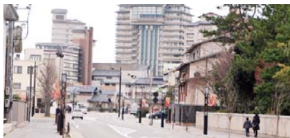
整備された和倉温泉内の道路