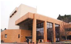
事務所が入る予定の和倉温泉観光会館