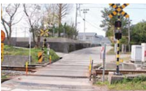
朝日小学校近くの踏み切り