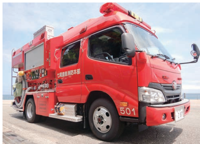
取得する同型の消防ポンプ自動車