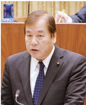
木下 敬夫 議員 (無党派)