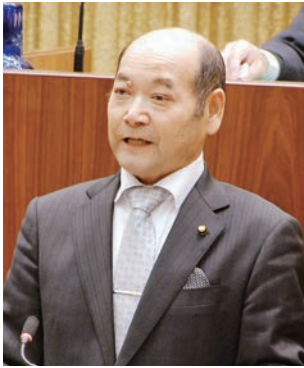
議員 正則 徳田 (新国会)