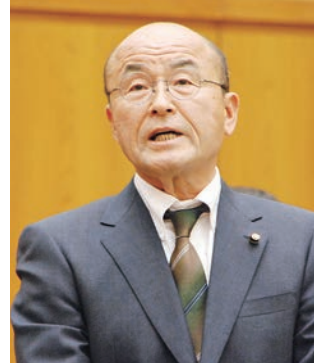
山添 和良 議員 (無党派)