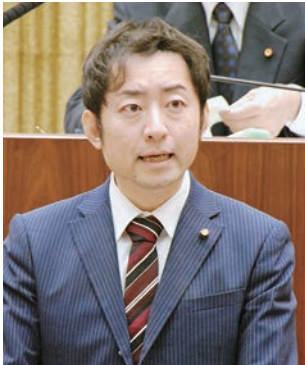
西川 英伸 議員 (新政会)