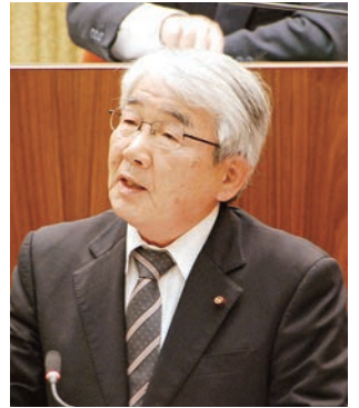
議員 和典 儀貝 (無党派)