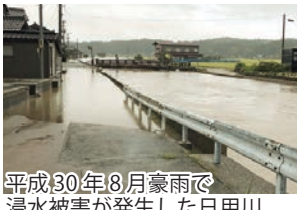
平成30年8月豪雨で浸水被害が発生した日用川