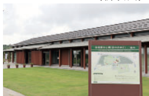
のと里山里海ミュージアム