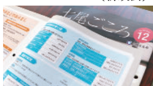
都市計画税の用途を記載している広報なお令和2年12月号