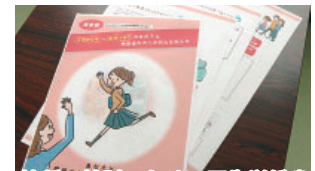
接種の検討のための厚生労働省が発行しているリーフレット

質 HPVワクチンは、子宮頸がんなどの原因となるヒトパピローマウイルスの感染を防ぐワクチンで、定期接種化されたが、一時積極的な接種勧奨を控えていた。今年10月に厚生労働省は接種の勧奨再開を決めたが、接種機会を逃した対象者への支援が課題だ。そこで次の3点について伺う。 ①厚生労働省が対象者に個別通知で確実に知らせるよう要請したが、それに対する対応 ②令和元年度と令和2年度の接種率 ③接種機会を逃した対象者への対応