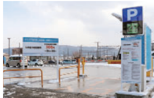
パトリア屋外第2駐車場