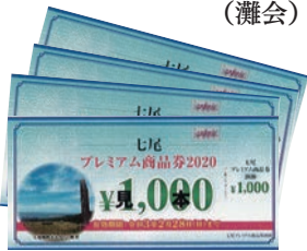
プレミアム商品券 (見本)