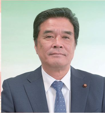
議長 杉木 勉

平素は 七尾市議会に対して ご理解とご厚情を賜り 厚く御礼申し上げます。 新たな年を迎えるにあたり 自らを律し 市政発展の一助となるべく 議員一同 今後も真摯に邁進して参ります。 市民の皆様方にとりまして