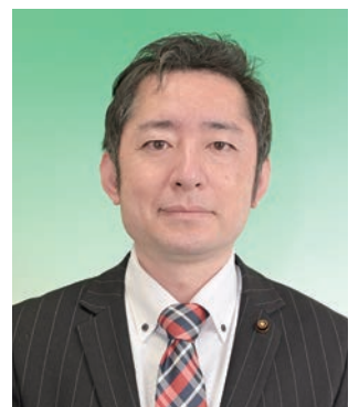
西川 英伸 議員 (市民クラブ)

今回の震災を受け、再度、現状把握を行い、ストックマネジメント計画の前倒しやそれに伴う予算の確保など、さらに要望していきたい。