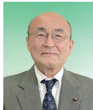
山添 和良 議員 (市民クラブ)