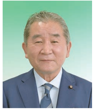
中西 庸介 議員 (新政会)