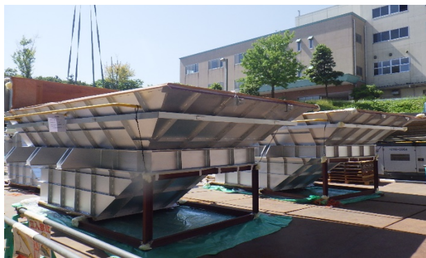
【写真④】耐火煉瓦施工（焼却炉）