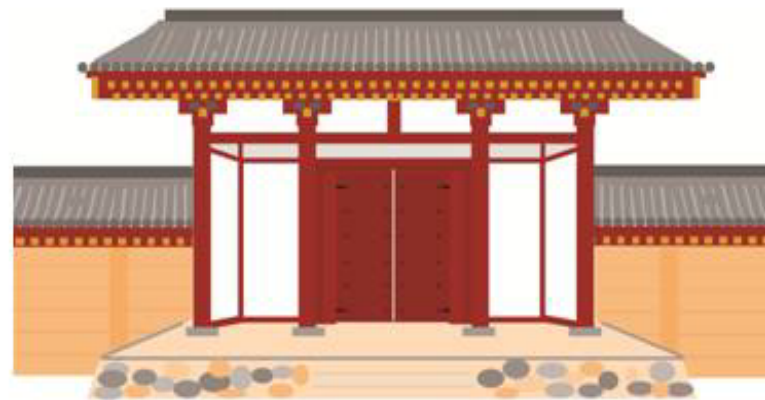
能登国分寺跡南門