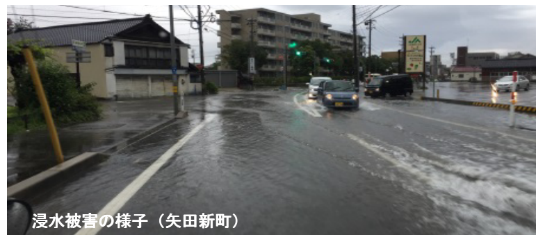
浸水被害の様子（矢田新町）