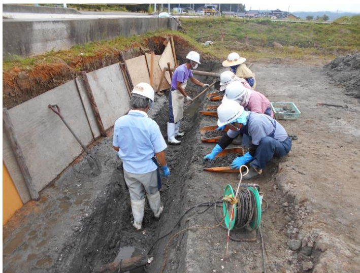
白浜ゴリゴ遺跡発掘調査状況