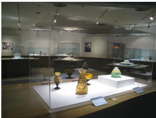
アールヌーヴォーのガラス展

中高生は就業体験を通し、職場としての美術館を体験することで、将来の職業選択はもとより、芸術、文化への興味関心を深めることに繋がった。