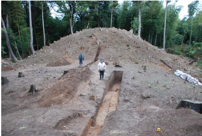
佐味今田谷内古墳群遠景写真