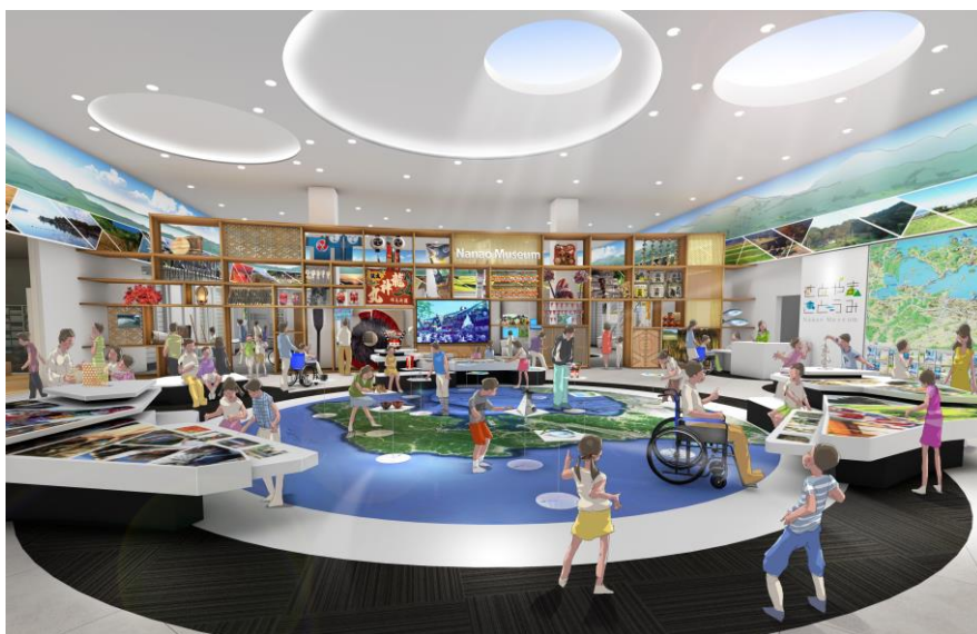
エントランスイメージ