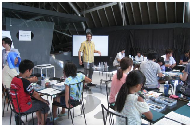
ガラス作家によるワークショップ