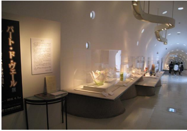
パート・ド・ヴェール展