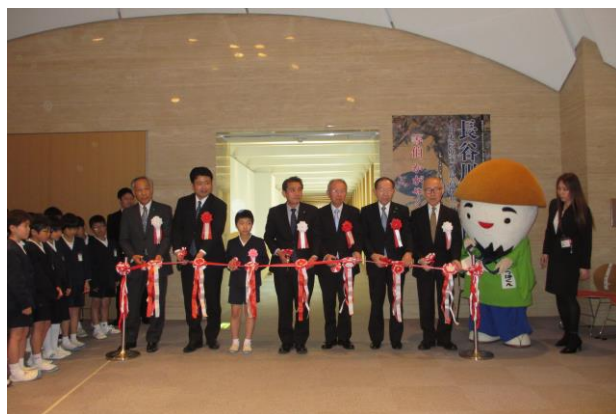
長谷川等伯展 開会式

長谷川等伯展では国指定重要文化財の展示に加え、市民の文化的財産として等伯作品を適切に展示、保存管理を実施した。