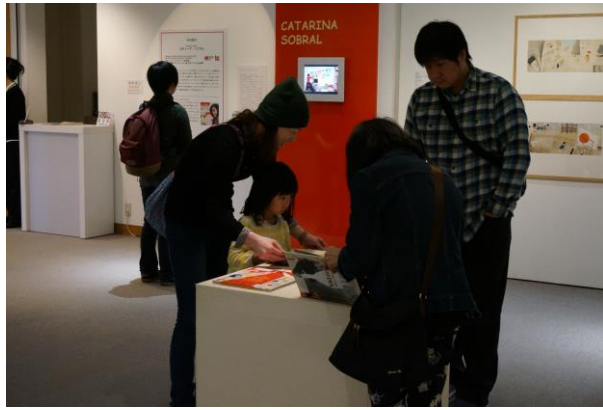
ボローニャ展を見学する親子