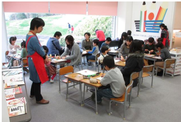
ボローニャ絵本づくりワークショップ