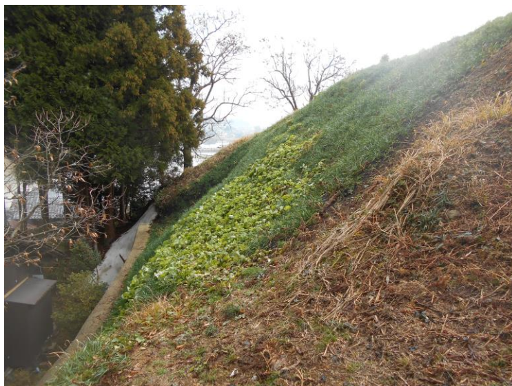
県指定史跡 上町マンダラ古墳群法面保護工事完了状況写真

文化財パトロールの実施（年1回） 指定文化財（史跡、天然記念物等）周辺除草管理 唐島神社社叢タブ林等管理支援（塩津町会） 無形民俗文化財後継者育成支援（七尾まだら保存会） 上町マンダラ古墳群法面保護工事（七尾市）