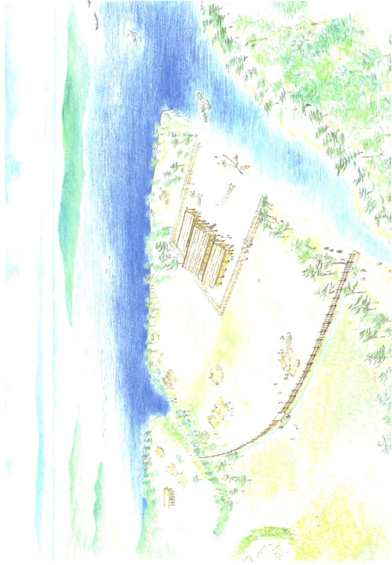
史跡万行遺跡復元イメージ(南東から)(北野陽子画)