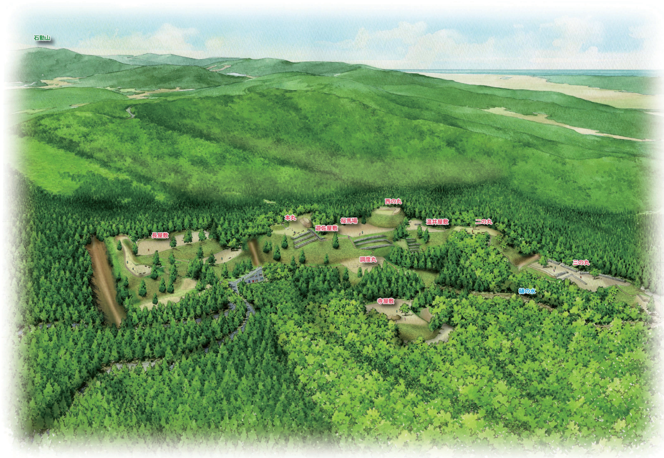
城郭中心部の整備イメージ図