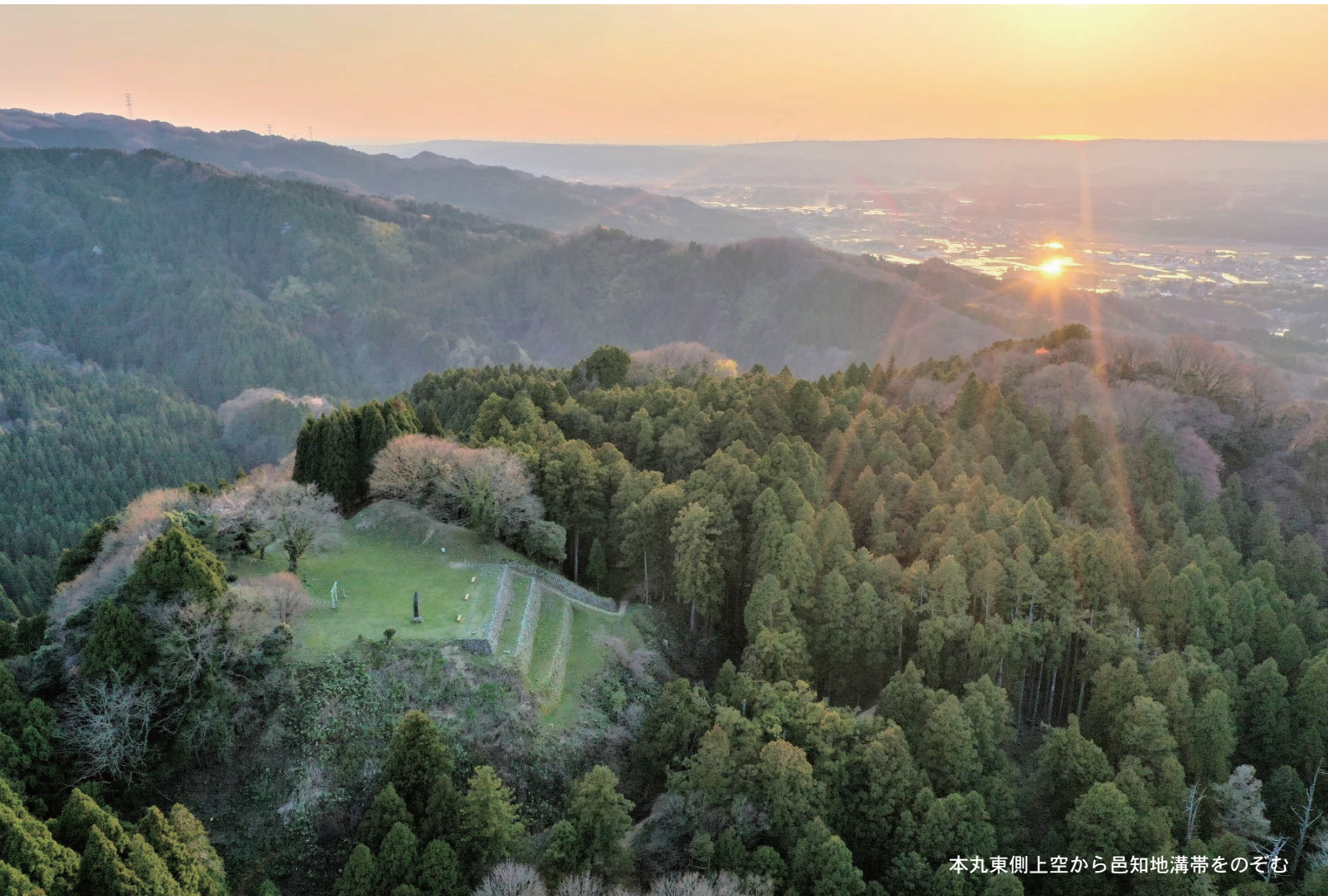
本丸東側上空から邑知地溝帯をのぞむ