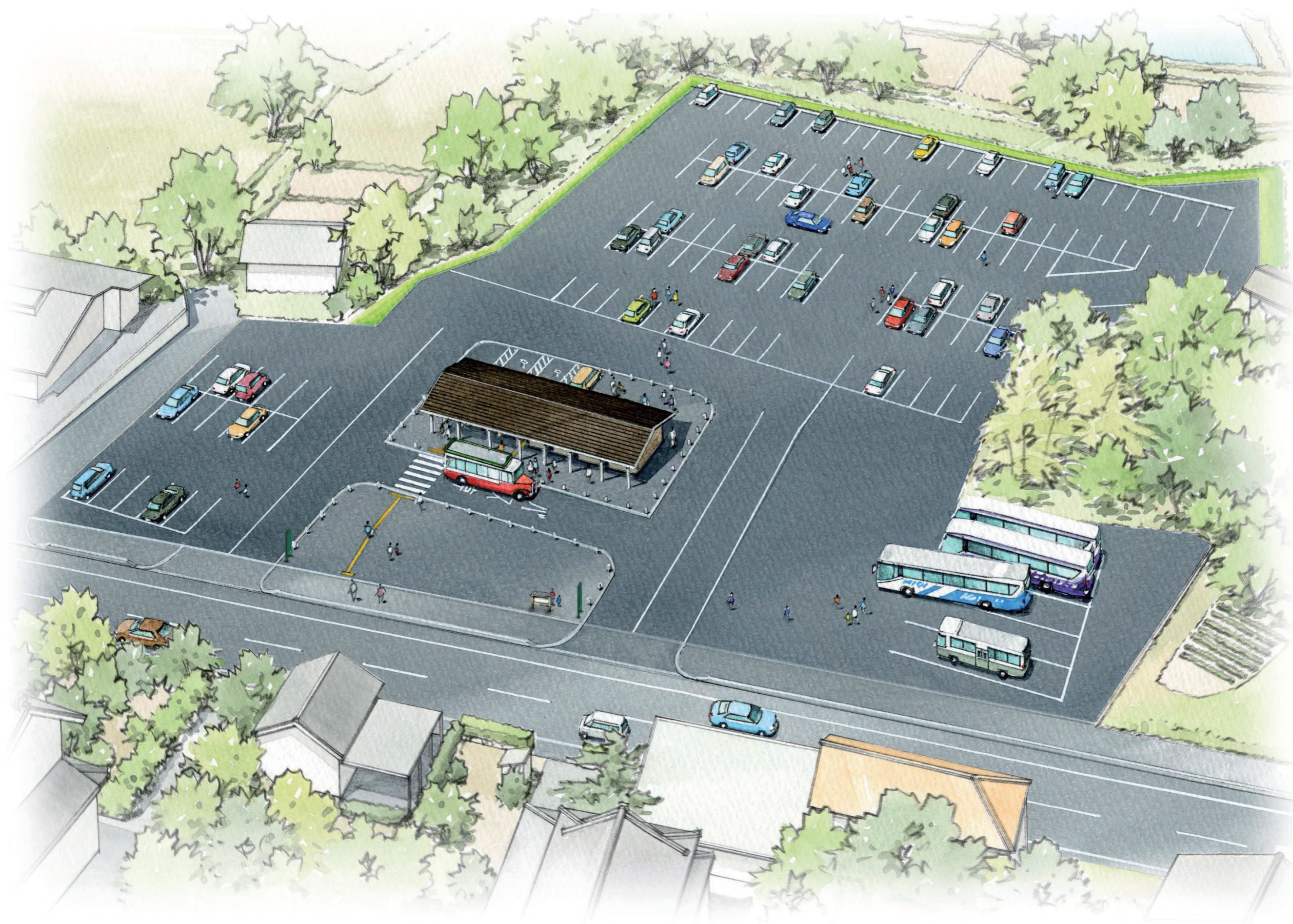
七尾城登山口駐車場の整備イメージ図