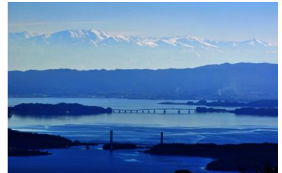
24. 能州の景(中島町別所) 七尾湾の全景