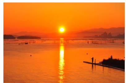
18. 熊来の海(中島町中島) 立山連邦より昇陽、牡蠣棚を照らす