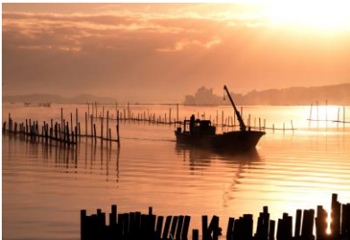
16. 牡蠣漁(中島町笠師) 七尾西湾のカキ棚と漁船