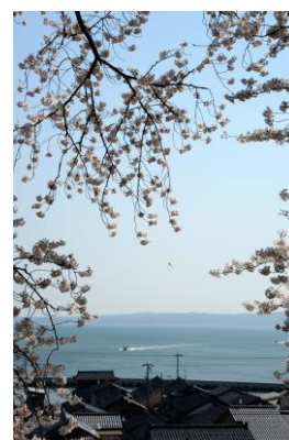
9. 春の海(石崎町) 石崎町の家並みと七尾南湾