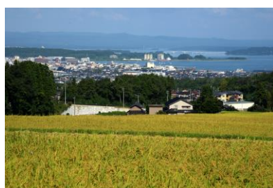
7. 秋の棚田(矢田町) 能越自動車道、城山IC付近の棚田より 市街地と七尾湾を望む