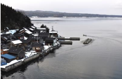
19. 海辺の集落(中島町長浦) 長浦集落より北湾を望む