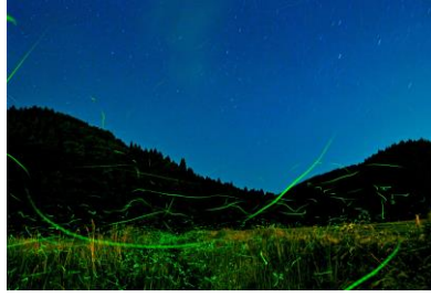
14. 舞螢(大津町) 初夏の大津川にホタル舞う