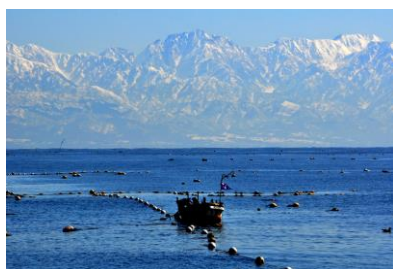
1. 定置網(大泊町) 灘浦海岸の定置網漁