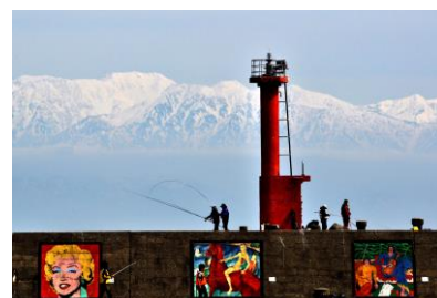
3. 釣り日和(佐々波町) 燈台と立山連邦