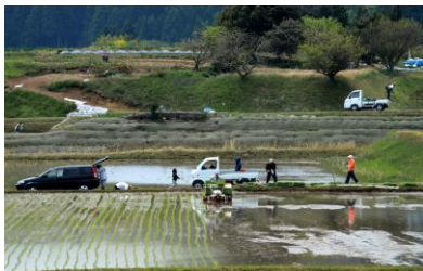
22. 田植えの頃(中島町外) 棚田の田植え風景