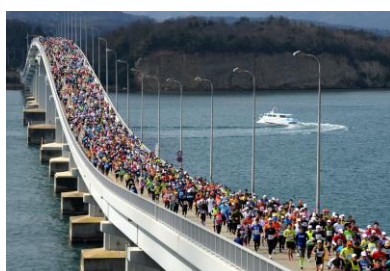
11. ランナー(能登島大橋) 能登島大橋を走る