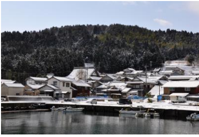
13. 雪の集落(能登島曲町) 雪の曲集落