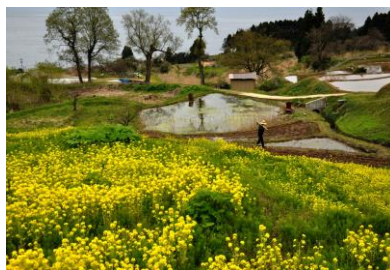
5. 里の春(百海町) 「七尾市の花」 満開の菜の花と棚田