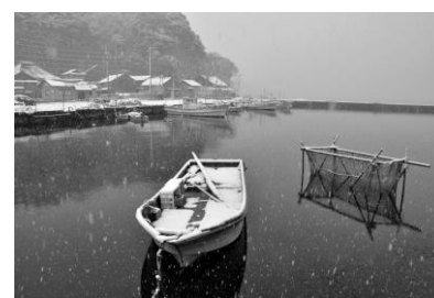
12. 雪の漁港(能登島日出ヶ島町) 降雪の日出ヶ島漁港