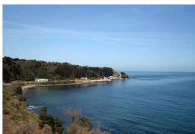
4. 国道160号沿線(黒崎町) 灘浦の風景