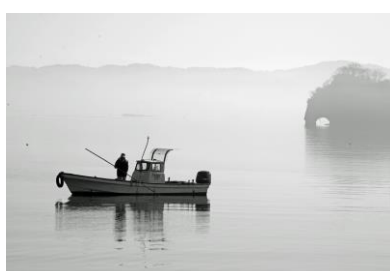
8. 霧の朝(松百町) 朝霧たつ七尾南湾 大立崎付近での海鼠漁船