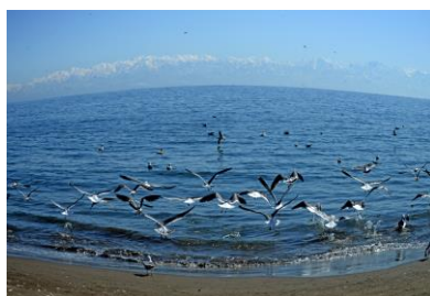
2. カモメ飛翔(佐々波町) 「七尾市の鳥」カモメ舞う 灘浦海岸&立山連邦