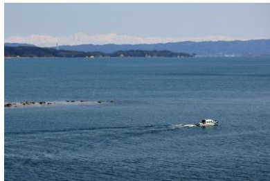
20. 七尾西湾(農道橋) 西湾全景、前面に能登島と 城山山系、背後に立山を望む