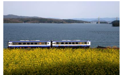
21. 春彩(中島町田岸) 満開の中島菜と「のと鉄道」、 正面には七尾北湾と能登島を望む