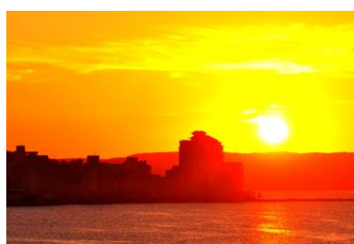
わくうらせきしょう 10. 湧浦夕照(能登島大橋) 夕陽に照らされた和倉温泉