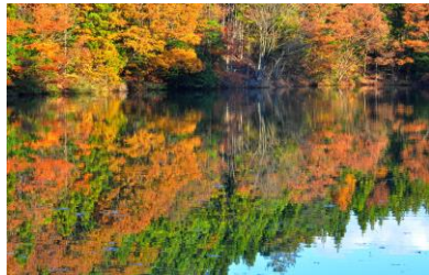
23. 秋彩(中島町中島) 能登にはため池の文化がある