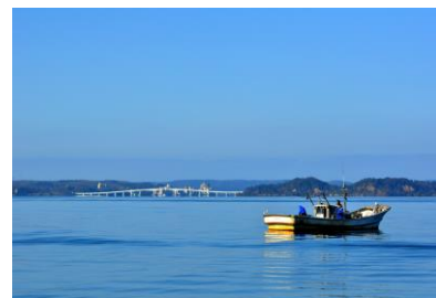
6. 冬晴れの湾(三室町) 七尾南湾の海鼠漁船