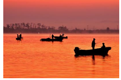
15. 湾の朝(白浜町) 七尾湾秋の風物詩、蛸つり風景